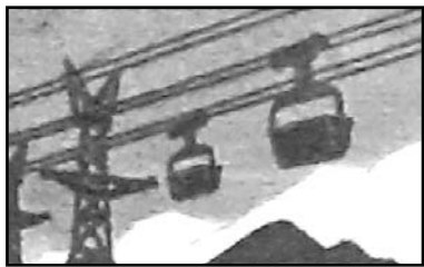
(Окончание. Начало в № 90)

К 170-ЛЕТИЮ САДОНСКОГО СВИНЦОВО-ЦИНКОВОГО КОМБИНАТА